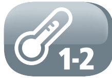
2 heating settings