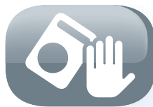
Tip over safety switch

Protección contra sobrecalentamiento: Este modelo puede ser utilizado con completa tranquilidad, ya que en caso de sobrecalentamiento la estufa se apaga automáticamente.