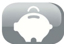
Tecnologia a ultrasuoni: risparmio nei consumi