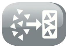
Filtro per l'acqua