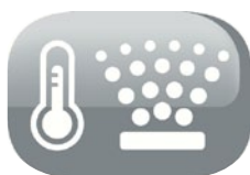
vapore fresco o caldo