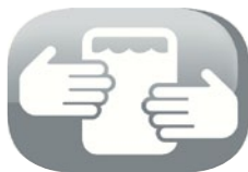
Capiente vaschetta rimovibile